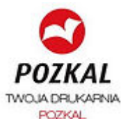
Drukarnia z Inowrocławia